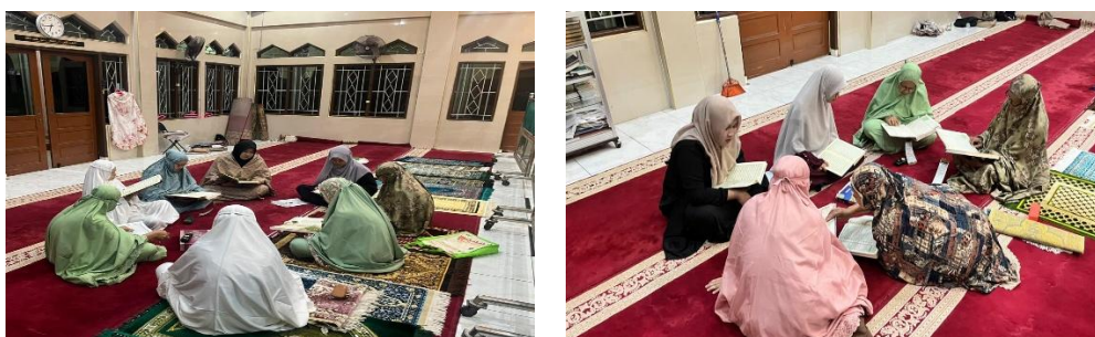
Gambar. Pelaksanaan Metode Talaqqi.

Pemilihan metode talaqqi sebagai pendekatan utama dalam program ini juga didasari oleh pertimbangan yang mendalam mengenai karakteristik belajar lansia. Secara psikologis, lansia mengalami sejumlah perubahan kognitif yang memengaruhi proses pembelajaran, di antaranya penurunan kapasitas memori jangka pendek, berkurangnya kecepatan pemrosesan informasi, dan menurunnya kemampuan untuk menyerap materi dalam jumlah besar sekaligus (Karyawati et al., 2023). Metode talaqqi dengan pendekatan pengulangan bertahap, koreksi langsung, dan interaksi tatap muka yang intensif terbukti sangat kompatibel dengan kondisi tersebut. Hal ini diakui sendiri oleh salah satu peserta yang menggambarkan pengalamannya: “Biar yang tadinya bisa-bisa ngaji tapi masih setidaknya salah-salah... semenjak ada anak KKN, kami bisa mengerti sedikit-sedikit” Informan (I2). Pernyataan ini menggambarkan bagaimana pendampingan bertahap yang diberikan mahasiswa KKN berhasil mengatasi hambatan yang selama ini dialami para lansia dalam memperbaiki bacaan mereka. Lebih lanjut, ketika ditanya mengenai efektivitas bimbingan langsung, seluruh peserta secara serentak menyatakan bahwa metode tersebut “sangat membantu” Informan (I3), yang