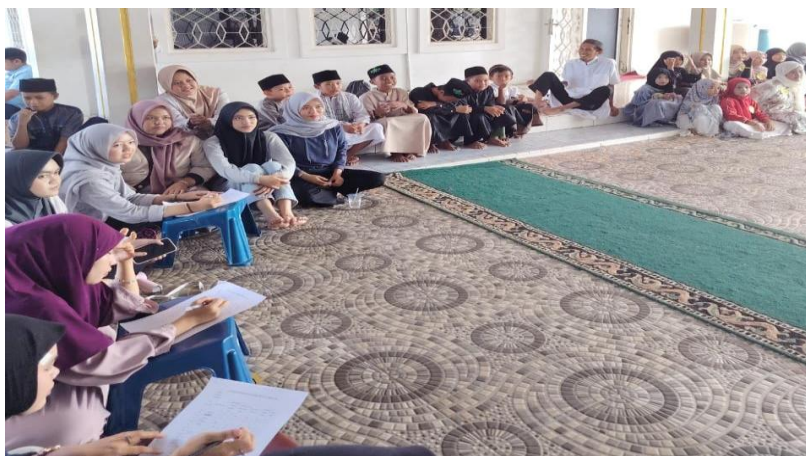
Gambar 1. Dokumentasi Pelaksanaan Lomba TPQ

Program lain yang dilaksanakan adalah kegiatan Didikan Subuh yang dirancang untuk meningkatkan keberanian, kedisiplinan, dan kemampuan keagamaan anak-anak. Dalam pelaksanaannya, remaja berperan sebagai pendamping, pembimbing hafalan, serta petugas pelaksana acara. Melalui kegiatan tersebut, remaja tidak hanya menjadi peserta, tetapi juga memperoleh kesempatan untuk belajar memimpin dan membimbing generasi yang lebih muda. Mahasiswa KKN juga mengajak remaja untuk terlibat dalam kegiatan mengajar anak-anak TPQ, seperti membaca Al-Qur'an, menghafal doa-doa harian, praktik ibadah, dan pembelajaran akhlak (Selfiyani et al., 2023). Kegiatan ini menjadi sarana bagi remaja untuk mengembangkan kemampuan komunikasi, kepemimpinan, dan kepedulian sosial.