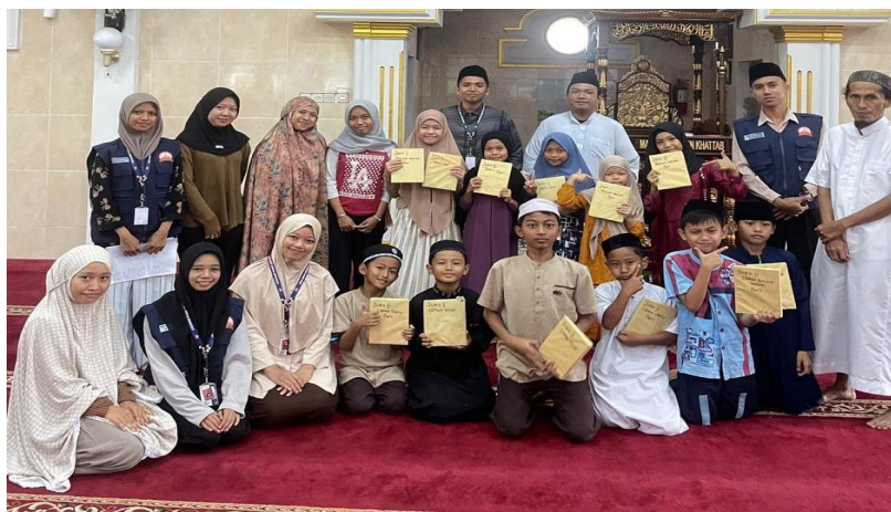
Gambar 2. Dokumentasi Kegiatan Didikan Subuh

Pendekatan pelibatan langsung dalam berbagai kegiatan tersebut terbukti mampu meningkatkan interaksi antara remaja dengan pengurus masjid serta menumbuhkan kembali semangat kebersamaan di kalangan remaja. Melalui pengalaman berpartisipasi secara aktif, remaja mulai menunjukkan rasa tanggung jawab terhadap kegiatan masjid dan terdorong untuk terus berkontribusi dalam program-program keagamaan yang dilaksanakan (Rahmanisa et al., 2026). Temuan ini sejalan dengan penelitian yang menyatakan bahwa partisipasi aktif remaja dalam kegiatan keagamaan dan sosial masjid dapat meningkatkan keberlangsungan organisasi remaja masjid serta memperkuat karakter religius dan sosial mereka.