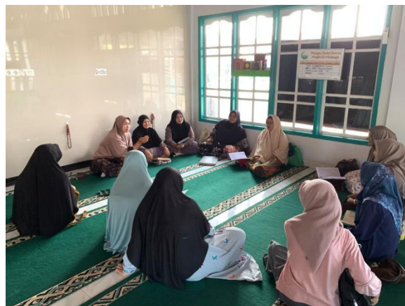
Gambar 2: Praktek Fardhu Kifayah