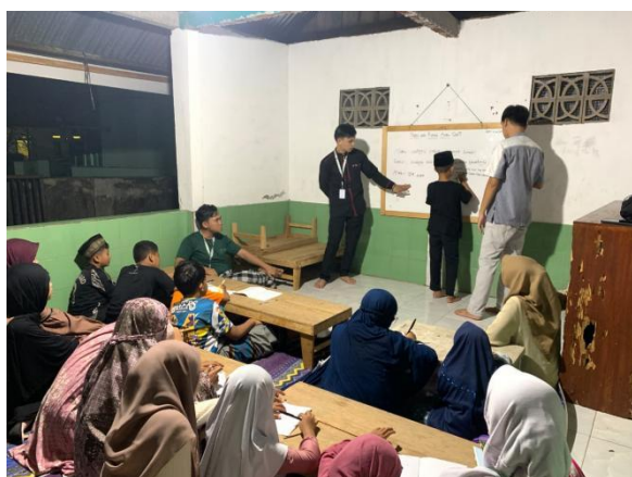
Gambar 5: Pengajian mingguan (Kamis dan Jumat)