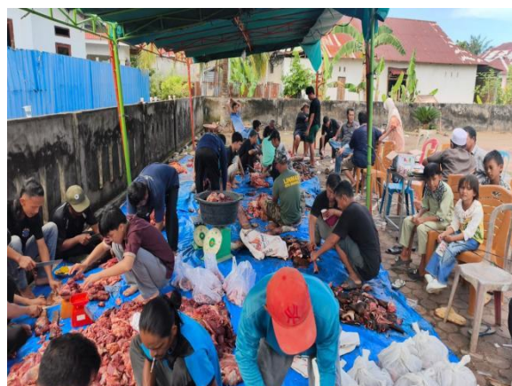
Gambar 4: Pelaksanaan Kegiatan Kurban