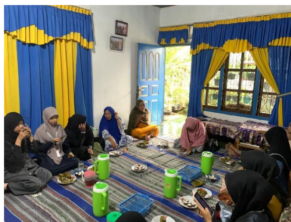
Gambar 6: Yasinan Mingguan