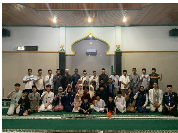
Gambar 3: Kegiatan Peringatan 1 Muharram