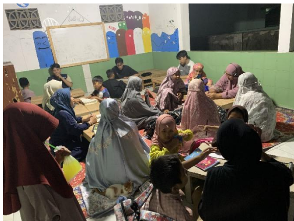
Gambar 1: Mengaji Al-Quran Setiap Minggu